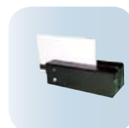
Tarjeta de Crédito